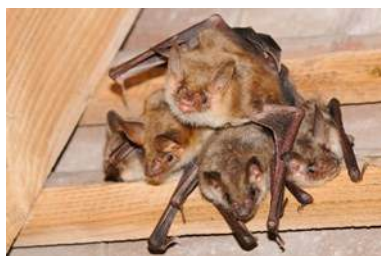
Le Grand Murin

A Noyers sur cher, nous avons la chance d'avoir plusieurs espèces de chauves-souris sur le site de la forêt de Grosbois, dont certaines sont rares. Les 2/3 de l'espèce du Grand Murin, 1/3 de l'espèce du Murin à oreilles échancrées et 40 % du Grand Rhinolophe du département sont présentes sur notre village. La faible pollution lumineuse mise en place par la commune par l'extinction des lumières, favorise la présence de ce petit mammifère.