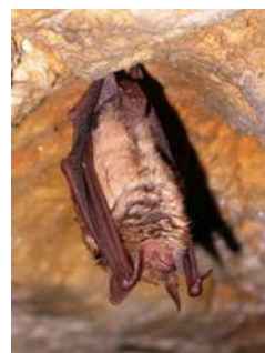
Grand Murin à oreilles échancrées